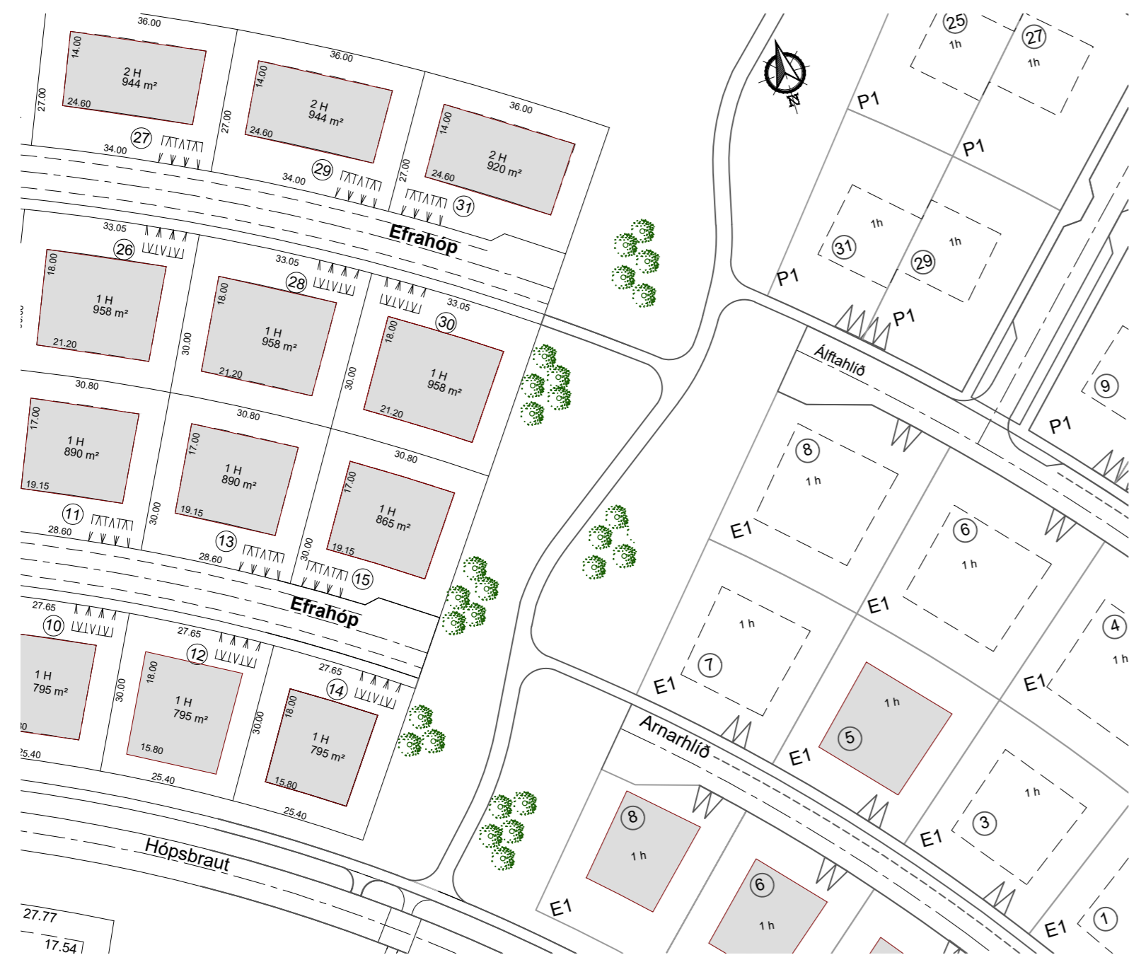
Gildandi deiliskipulag, skipulagið öðlast gildi 13. des. 2006