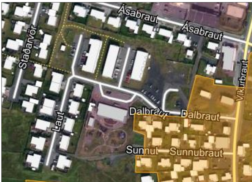
Mynd 2-2 Deiliskipulag í gildi á svæðinu, skjámynd úr skipulagsvefsjá Skipulagsstofnunar.

Við götuna Laut er ekki í gildi deiliskipulag. Á aðliggjandi svæði er í gildi Deiliskipulag gamla bæjarins , samþykkt 29.3.2016 með síðari breytingum.