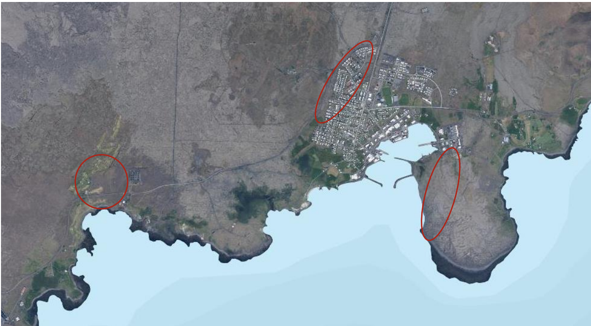
MYND 1 Svæði sem taka breytingum eru afmörkuð gróflega (map.is).