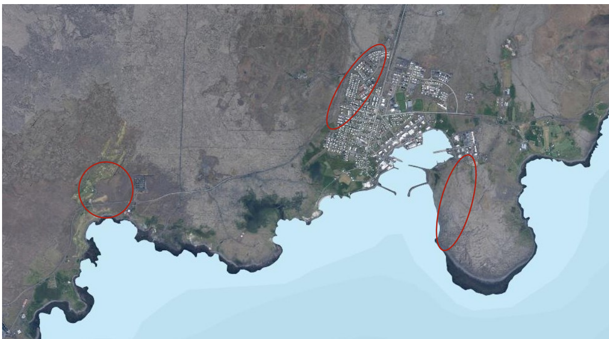
MYND 1 Svæði sem taka breytingum eru afmörkuð gróflega (map.is).