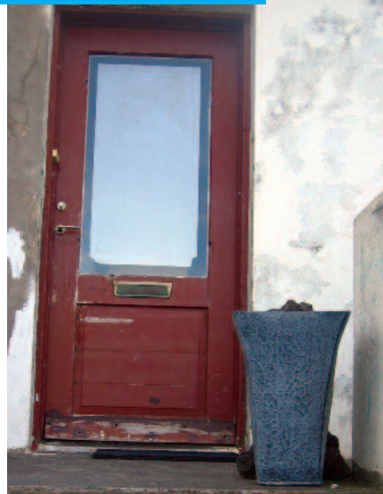
Nafn götu og húsnúmer: