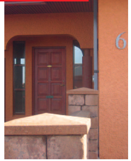
Nafn götu og húsnúmer: