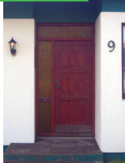
Nafn götu og húsnúmer: