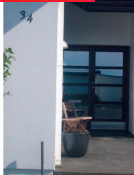
Nafn götu og húsnúmer: