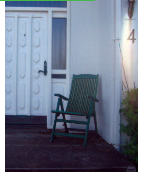
Nafn götu og húsnúmer: