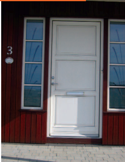
Nafn götu og húsnúmer: