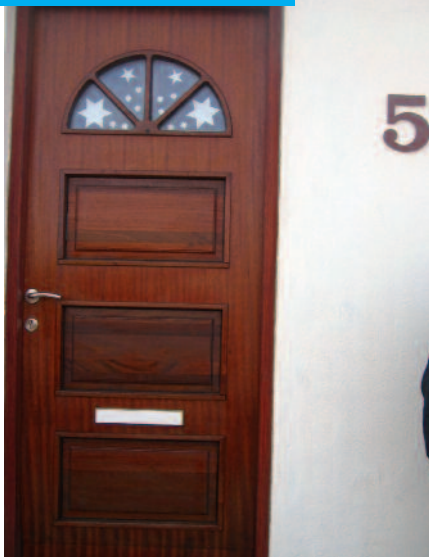
Nafn götu og húsnúmer: