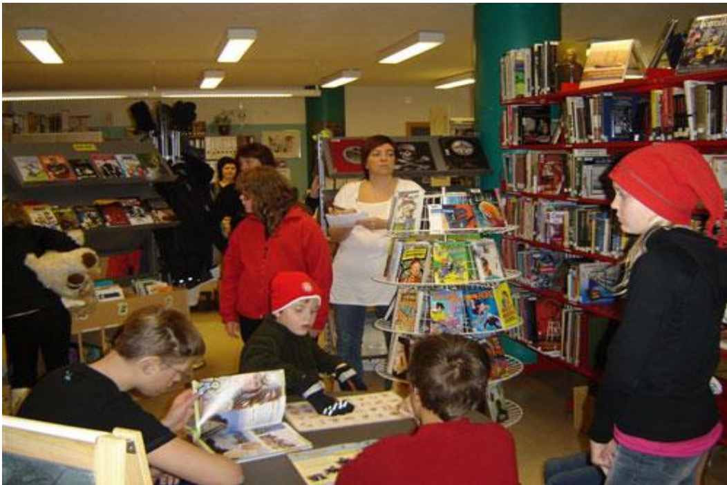
Nokkrir nemendur Grunnskólans komu í heimsókn

Við lok árs var búið að gefa út 1070 lánþegaskírteini (876 um áramótin '07-'08)