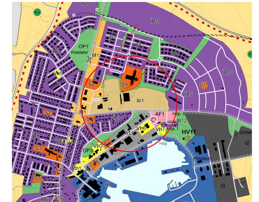
HLUTI ÚR GILDANDI AÐALSKIPULAGI 2018-2032

Að öðru leyti gilda eldri skilmálar deiliskipulags fyrir svæðið.