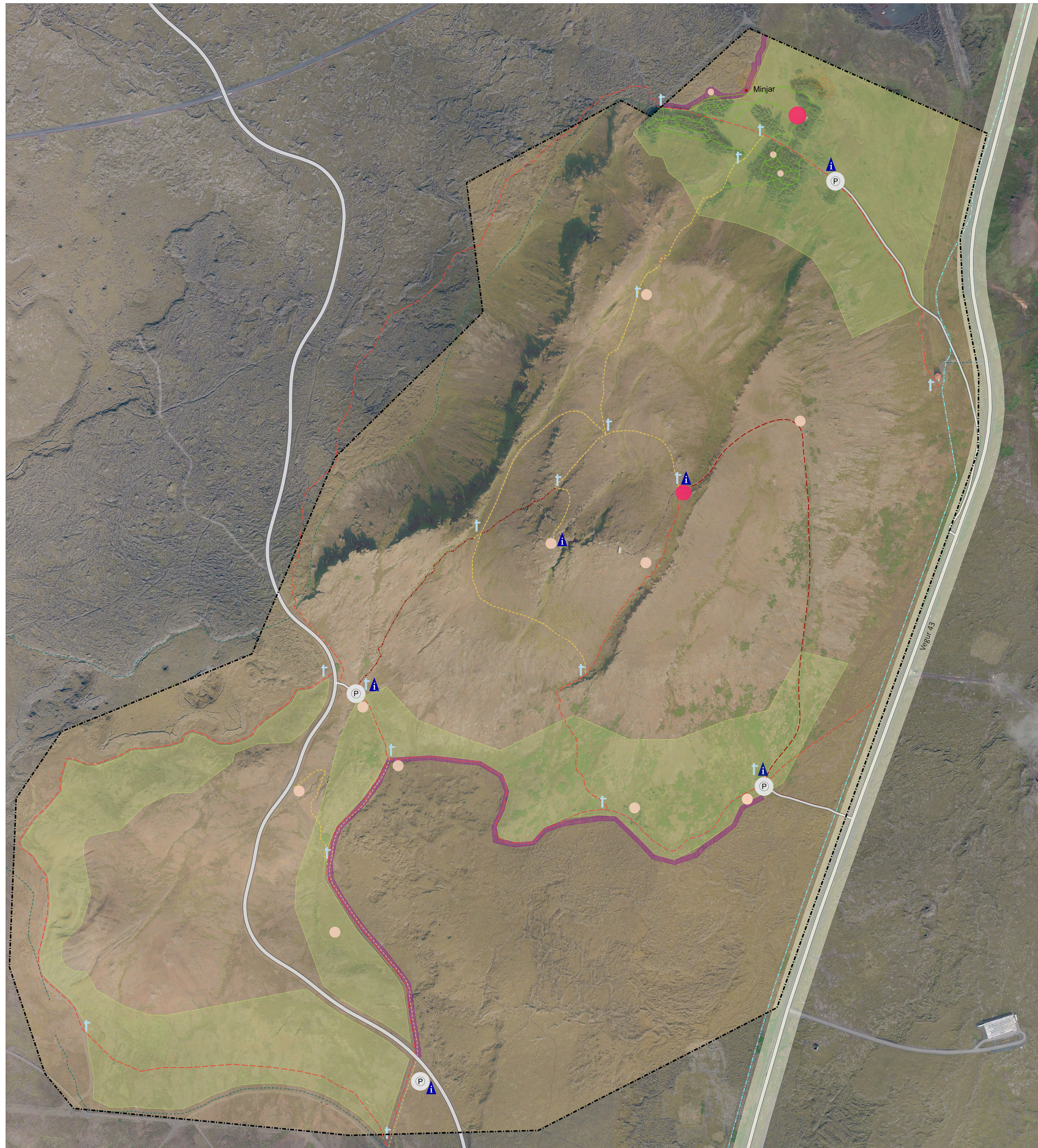
Deiliskipulagsuppráttur mkv 1:3000